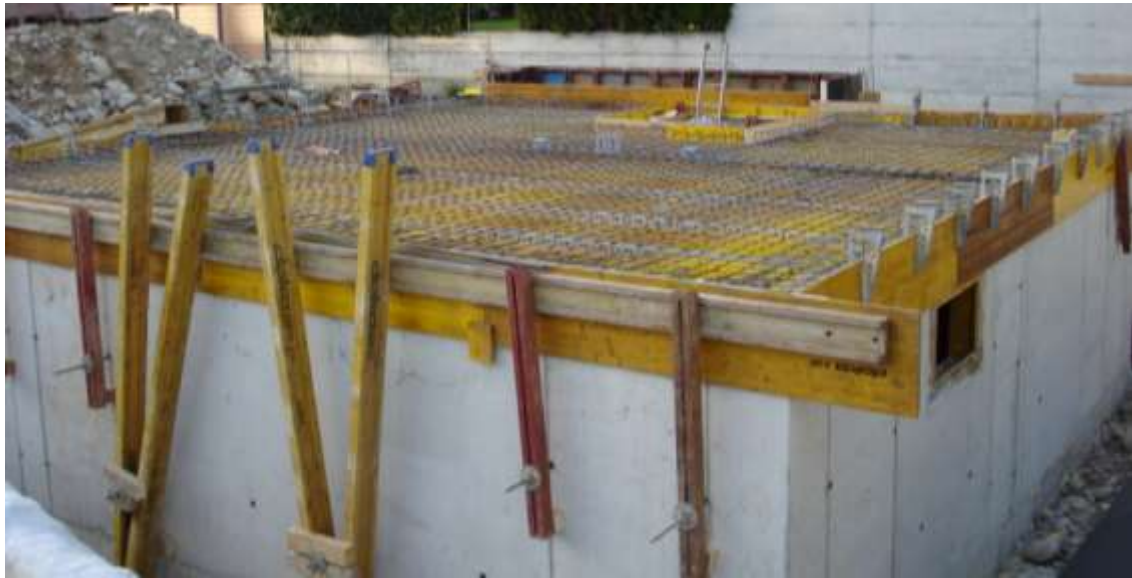
Al 19 d'otober a sem ala 2° soleta ...