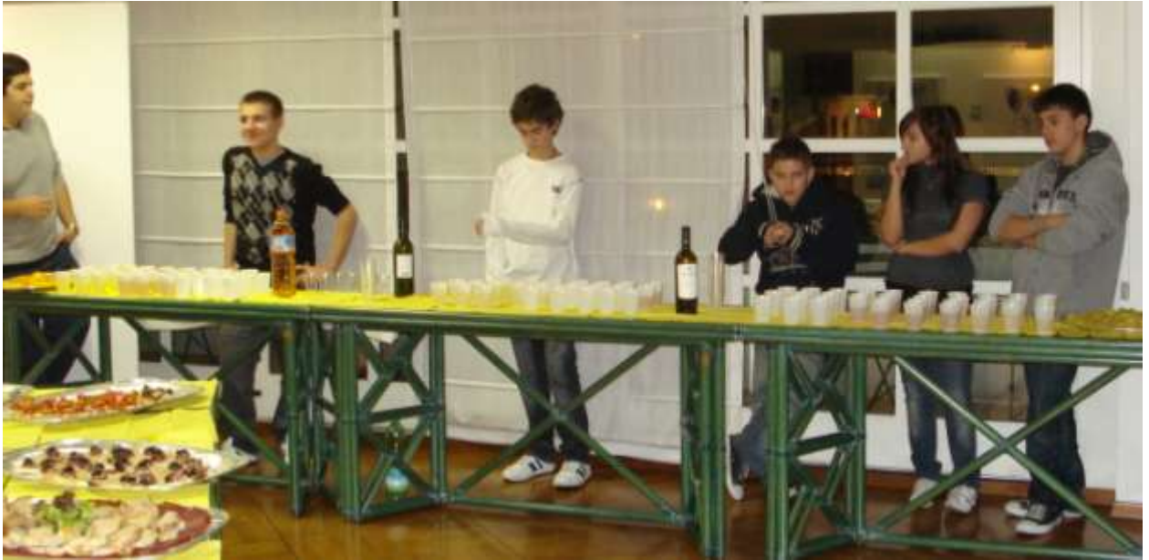
I bravi giovani aiutanti