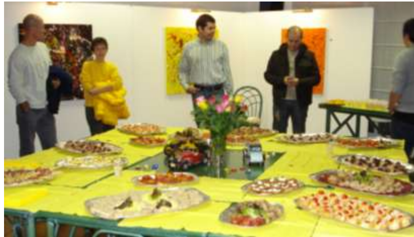
Gli apprezzatissimi manicaretti