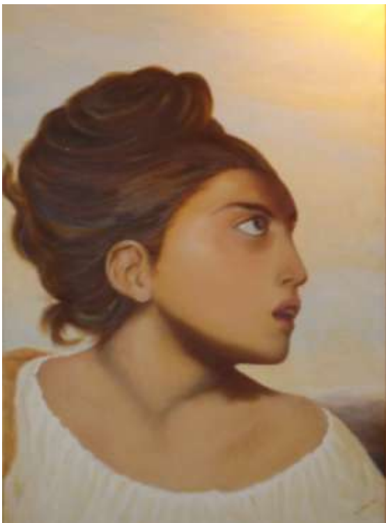
Profilo di giovane donna