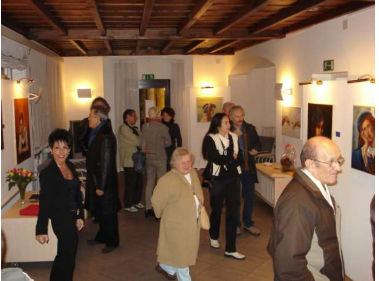
L'artista tra i visitatori