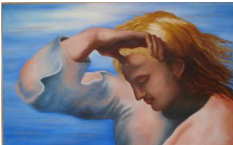
San Giovanni (da Raffaello)