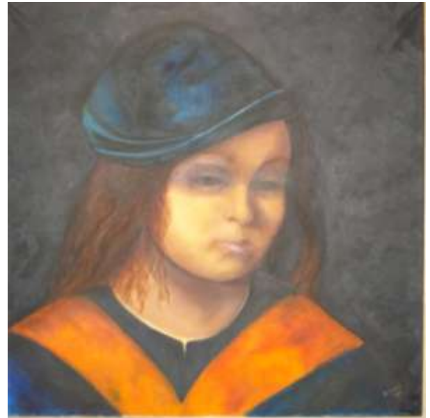
Ritratto (da Giorgione)