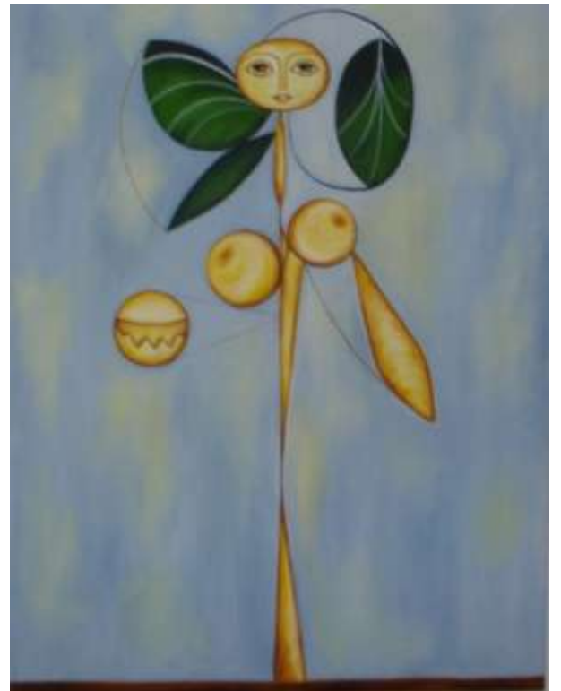
Woman flower gialla