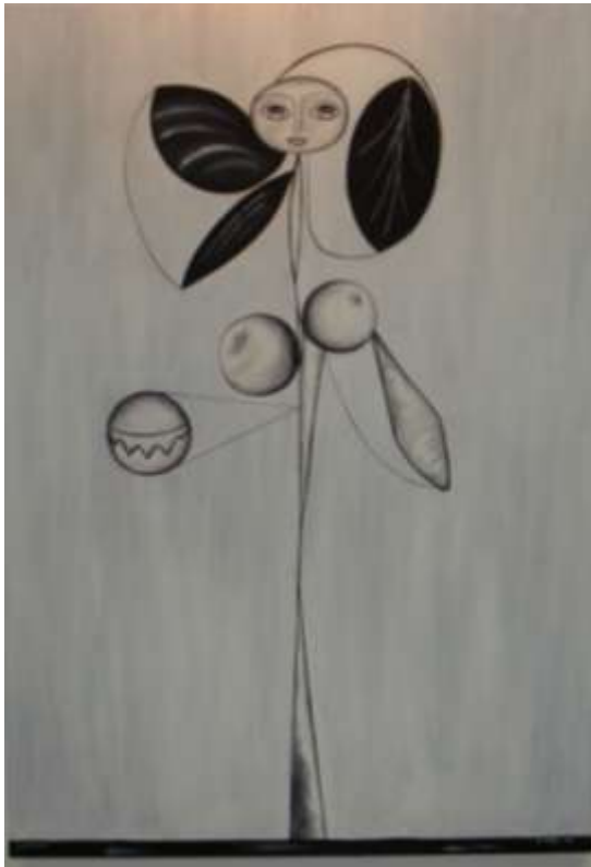
Woman flower bianco nero