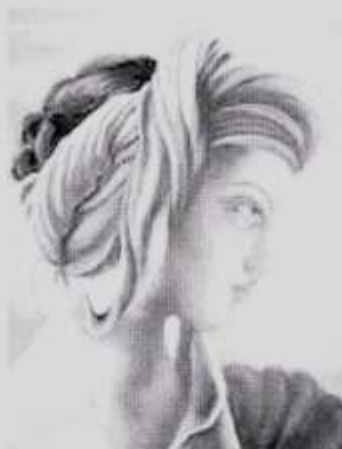
Un'opera dell'artista muraltese.

La mostra è allestita in collaborazione con l'Associazione Muralto per tutti e grazie alla gentile disponibilità del Municipio e del Gruppo Anziani di Muralto.