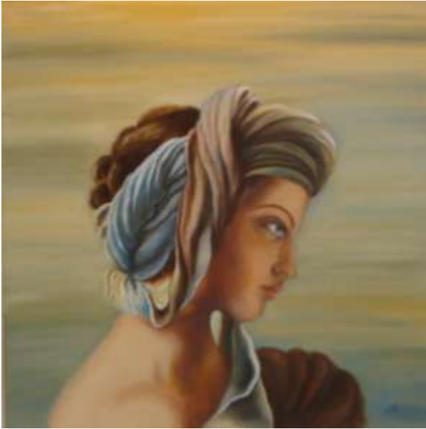
Donna con turbante (da Francesco Hayez)