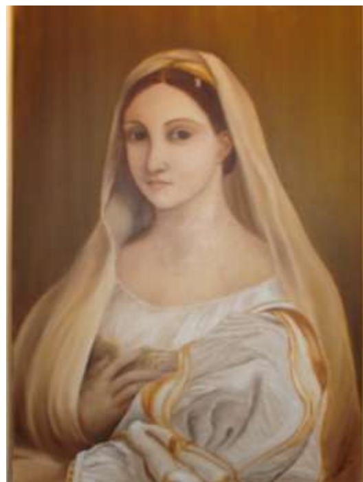
La velata (da Raffaello)