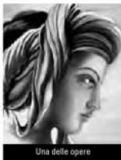
Una delle opere