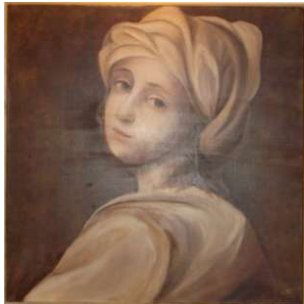
Beatrice Cenci (da Guido Reni)