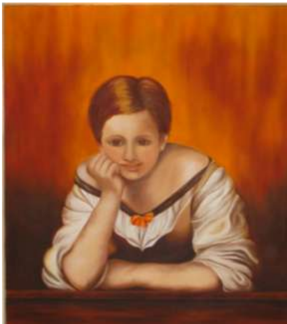
Donna alla finestra (da B.E.Murillo)