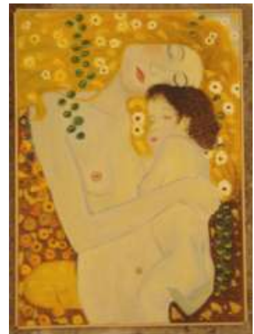
Le tre età