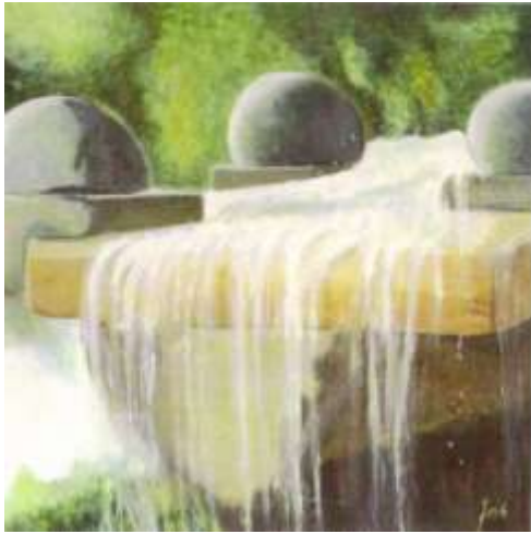
Fontana a Singapore