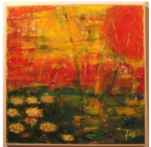
Ninfee al tramonto