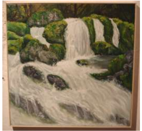
Acqua sui sassi muschiati