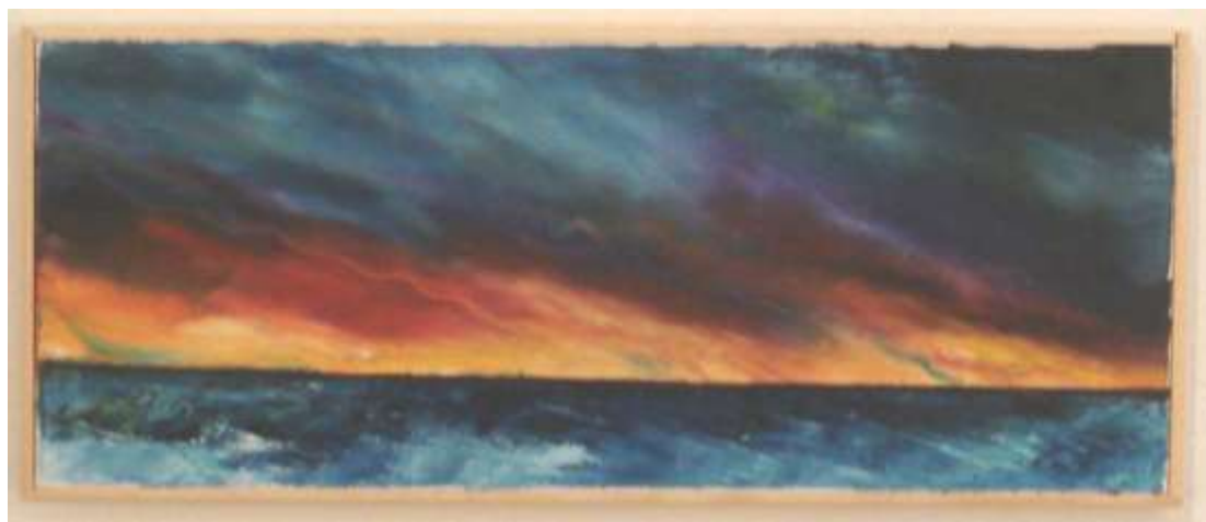
Fantasia di colori