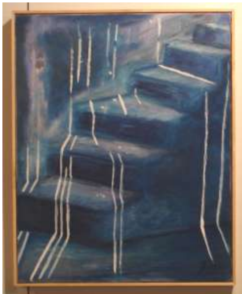
Scala blu in Grecia