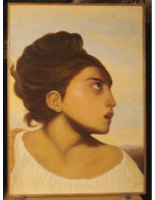
Profilo di giovane donna