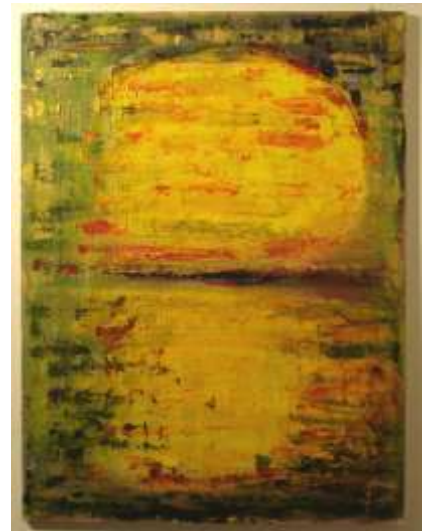
Tramonto a Lima