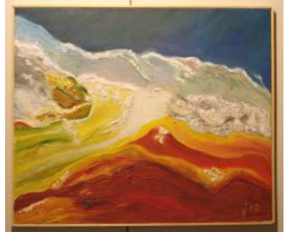
Terra , zolfo , sale , mare