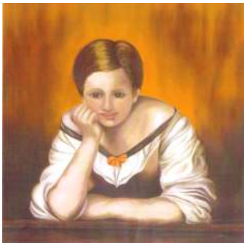
Donna alla finestra