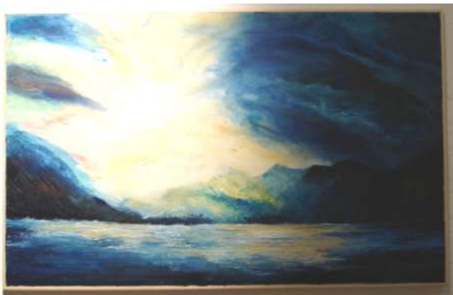
Tramonto sul lago