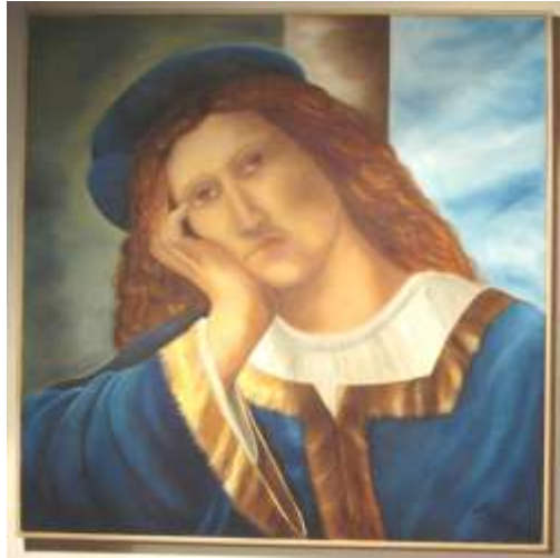
Ritratto di giovane