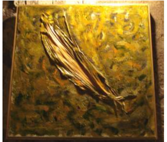
Foglia nella tempesta