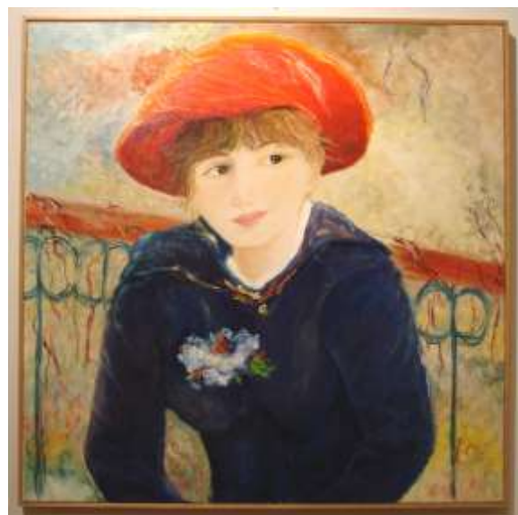
Donna dal cappello rosso