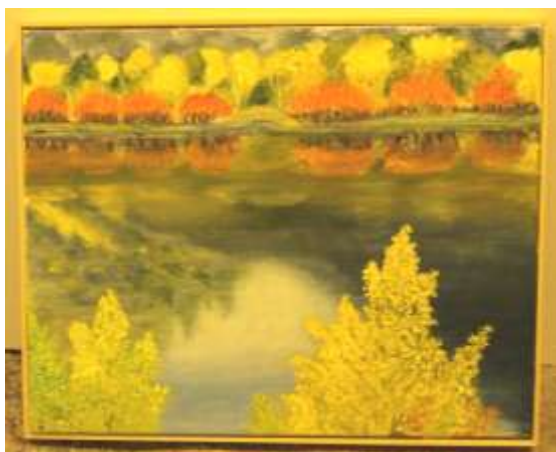
Autunno in Canada