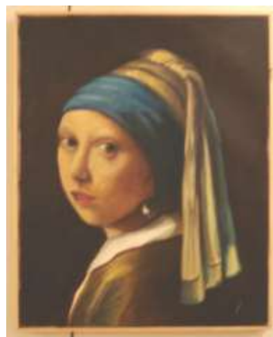
Ragazza dall'orecchino di perla