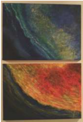
Fra terra e mare