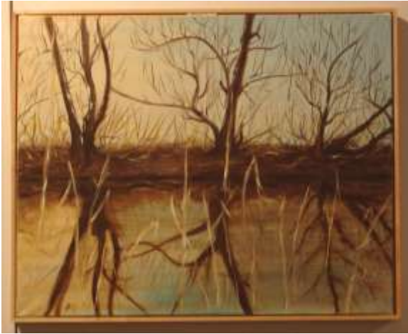
Bolle di Magadino