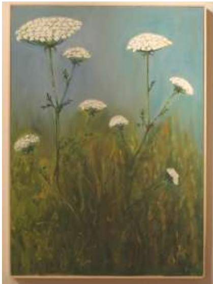
Fiori di prato