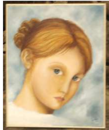
Ritratto di fanciulla