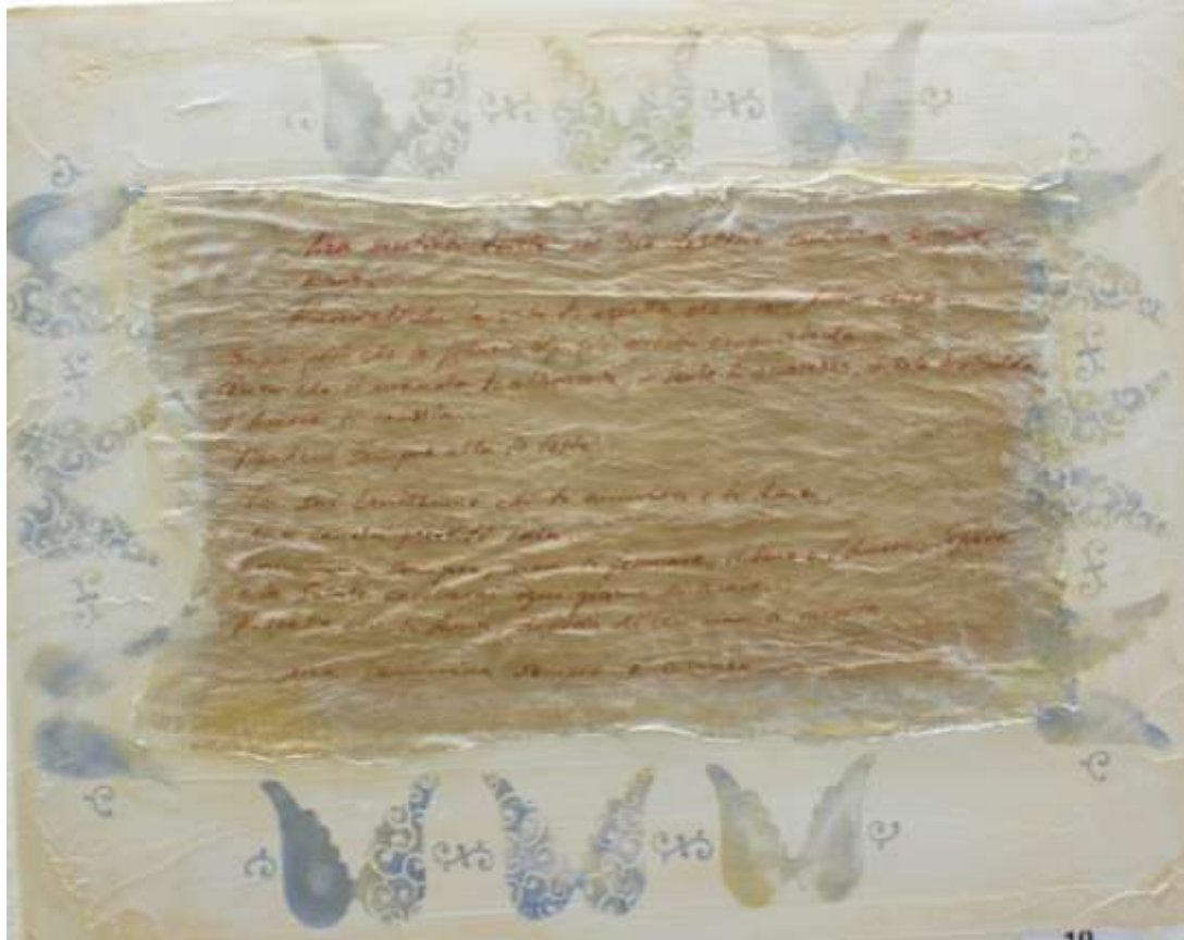
Un'opera di Giordi Bianda sulla quale è riportata una poesia di Oswaldo Codiga