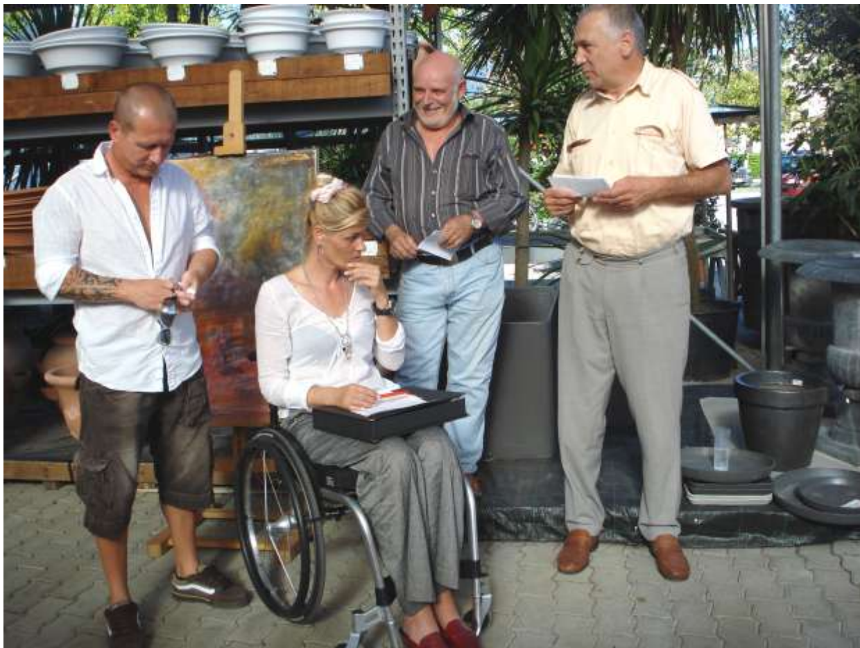
Foto di gruppo al momento dei discorsi di apertura