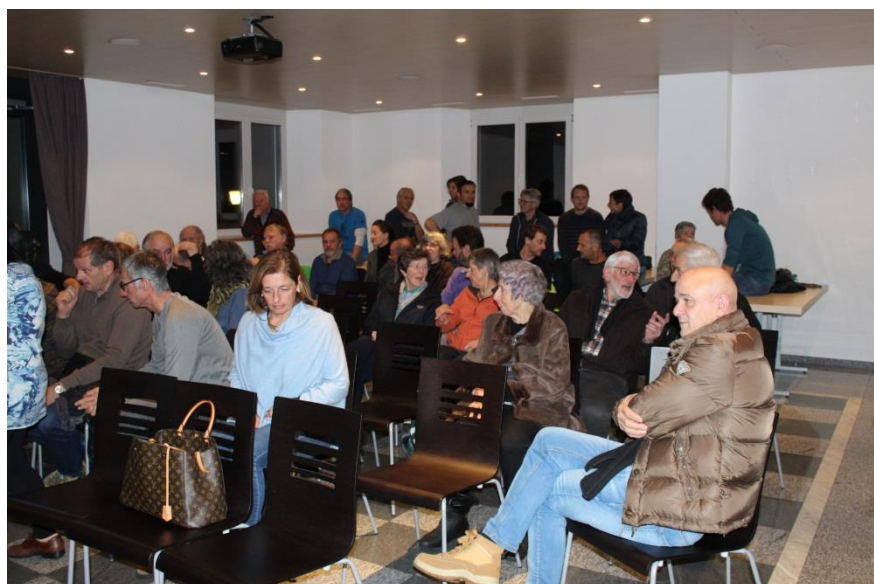
Il pubblico in sala