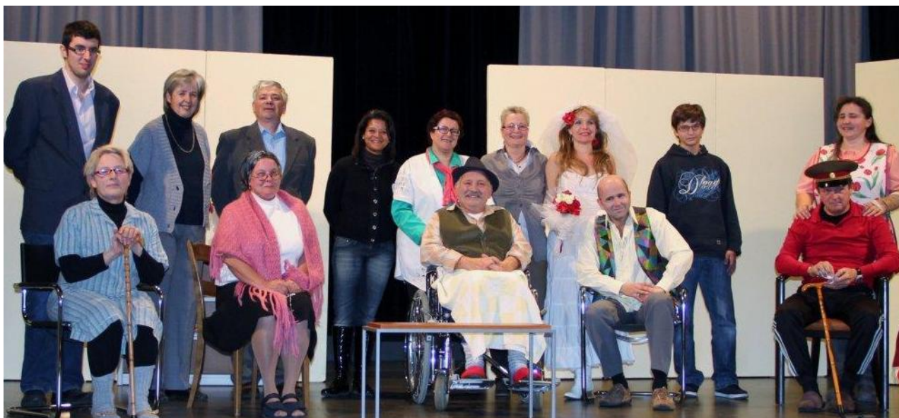
I bravi atòr del "Graz" ...