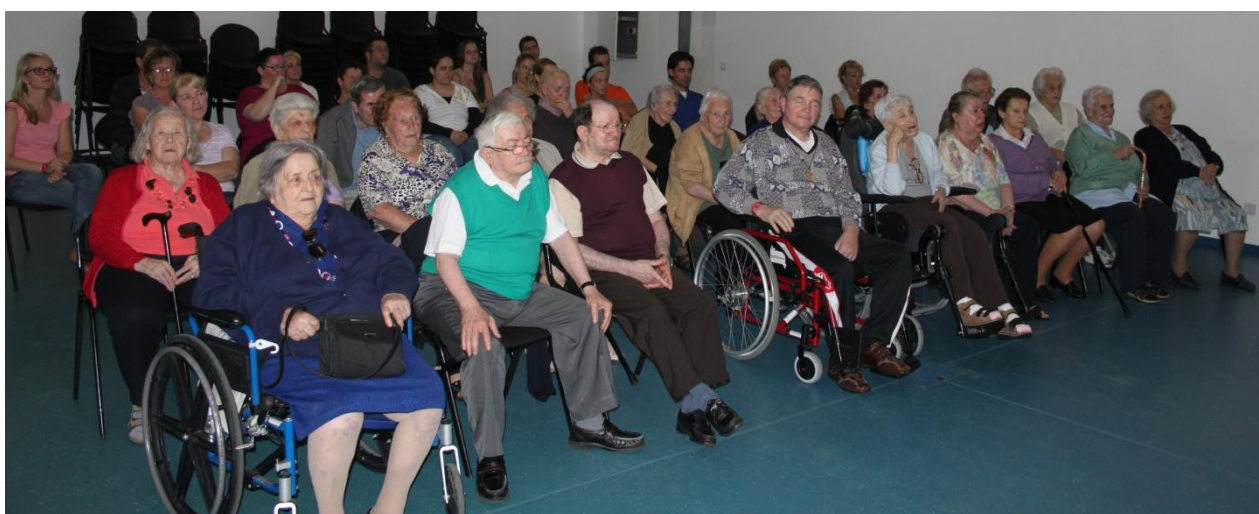
... el püblich u seguis i atòr ...