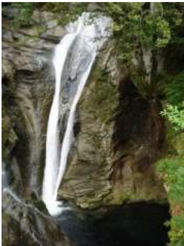
A sinistra la cascata dietro al mulino ripresa in una mia fotografia