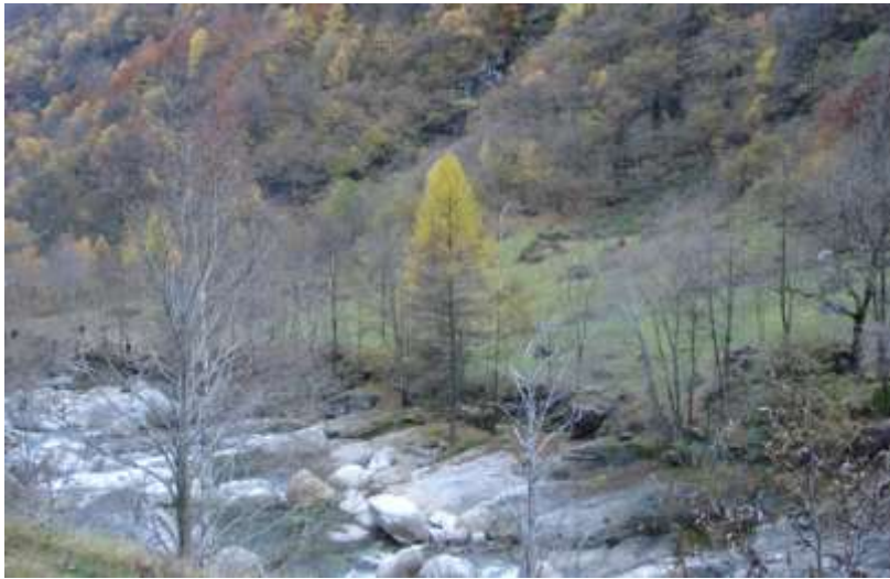
Autunno al Bolastro – Val d'Osola – Brione Verzasca