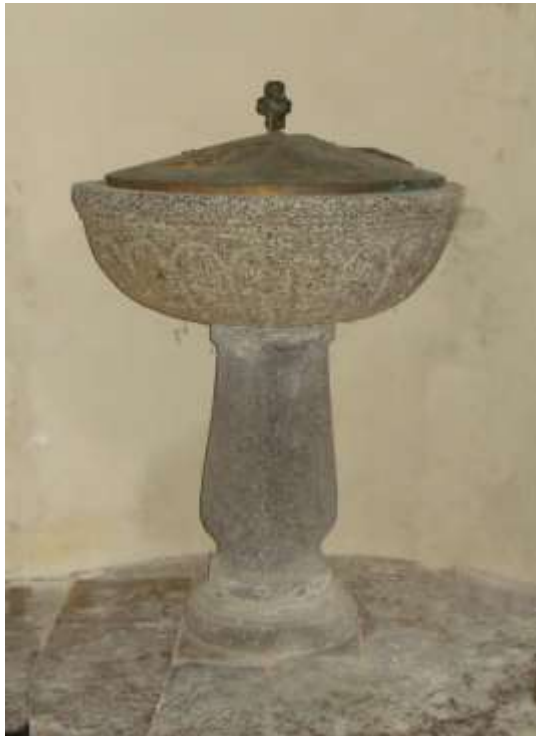
La Fonte Battesimale nella Chiesa di Frasco

La Chiesa di Frasco é dedicata a S. Bernardo d'Aosta . È stata costruita attorno al 1500 e poi rinnovata attorno al 1600 e poi ancora attorno al 1800 . Oltre alla Fonte Battesimale in granito con il coperchio in ottone ci sono pure due acqua-santiere in marmo. Una é all'entrata principale e l'altra alla porta laterale.