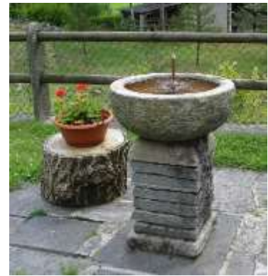
Fontanino a casa Epis