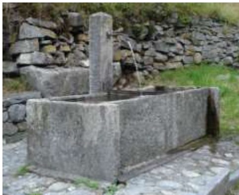
Fontana a Gerra Verzasca sotto alla strada Cantonale

Sempre sotto alla strada cantonale nel bel mezzo delle case c'è una fontana