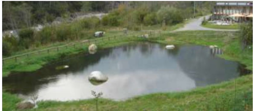
Sempre in zona Torbola c'é il bellissimo biotopo creato in entrata al paese di Frasco e chiamato "El poz di ran"