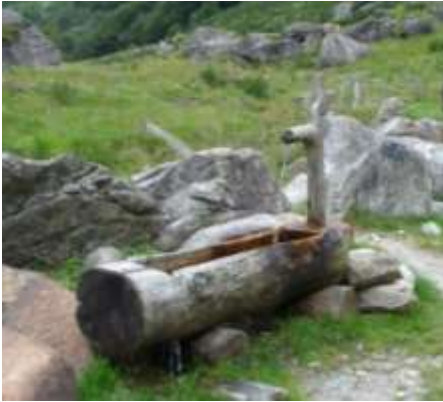
Fontana a Cabioi