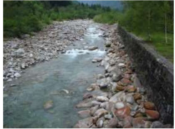
Il fiume ripreso dalla passerella