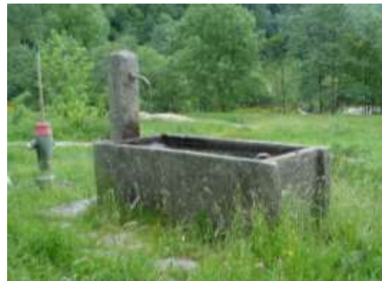
Fontana in zona "Alla Croce" sotto alla strada Cantonale