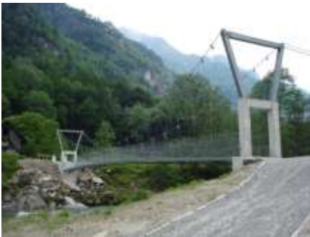
A sinistra la nuova passerella per Cordasc

La nuova passerella porta su di un nuovo sentiero. Nel bel mezzo di un prato poco lontano dalle baite c'é una bella fontana.