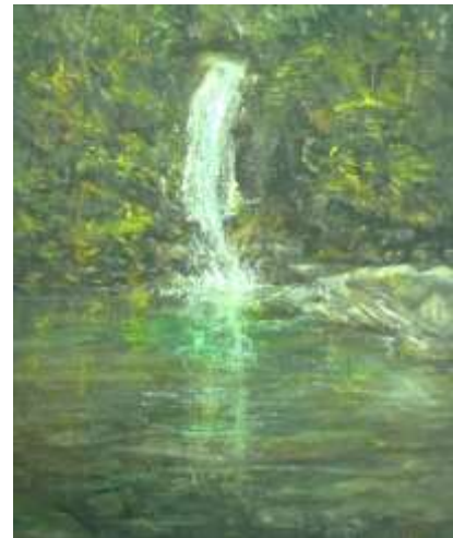
A destra la stessa cascata in un quadro a olio su tela di Fausto Corda ⇒