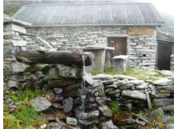
La fontana alla Capanna Sanbuco