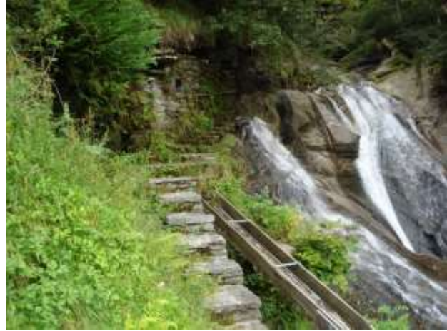
La "presa" d'acqua per mulino e centralina