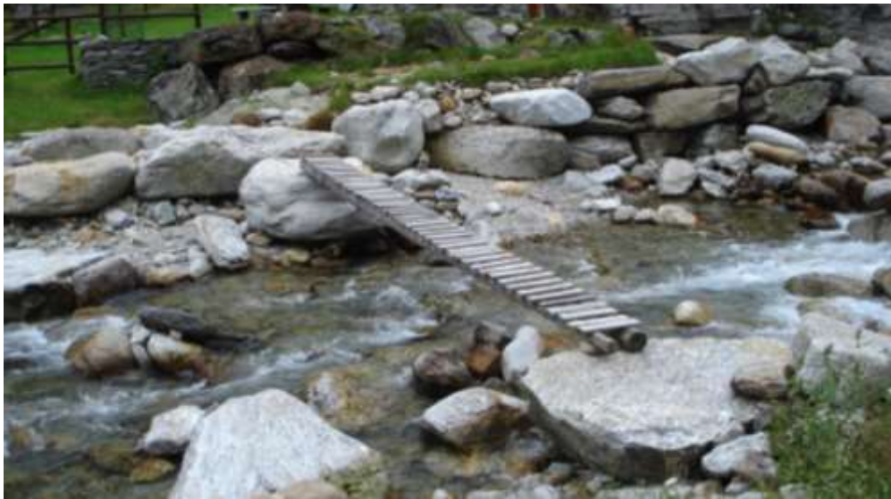
Altra passerella privata posata sulla Val Vogornesso e che attraversa il fiume prima di Cabioi