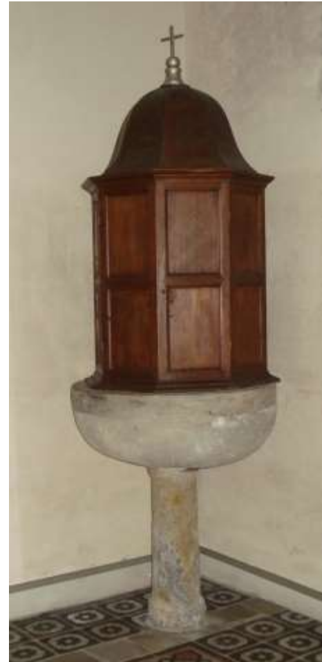
La Fonte Battesimale nella Chiesa di Gerra Verzasca