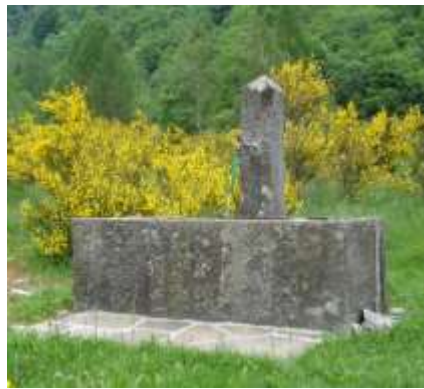
Le due fontane immerse nei colori della natura ad Alnasca