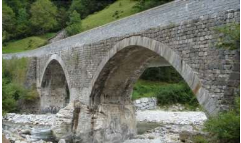
Il vecchio ponte tra Gerra e Frasco

Continuando sulla cantonale si arriva al ponte che porta a Frasco . Qui hanno costruito il nuovo ponte ma hanno lasciato anche quello vecchio che funziona da passerella per pedoni e ciclisti.