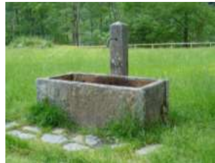
A destra la fontana a Cordasc