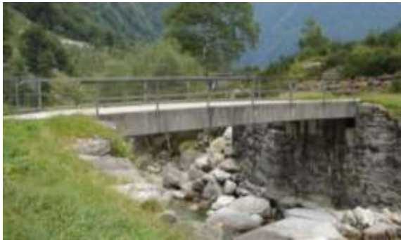
← Il ponte per Cabioi che attraversa la Valle Vogornesso

Una buona parte della Valle Vogornesso é territorio del paese di Frasco. Per arrivarci bisogna passare su di un pezzo di strada in territorio di Sonogno . Prima di arrivare a Cabioi si riattraversa il fiume.