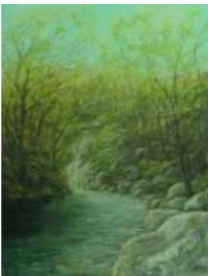
← A sinistra il Fiume a Gerra Verzasca (olio su tela di Fausto Corda)