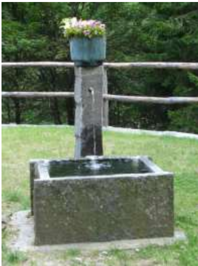
La fontana al Paniel di Mot