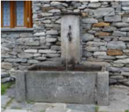
Altra bela fontana in mez ai cà nela piazzeta che a ghé in zona Torbola . Anca chesc'ta l'é un regal di Benefattori Californiesi e la ga sü la data del 1901 sc'tampada sota al tübo indoa la vegn föra l'acqua