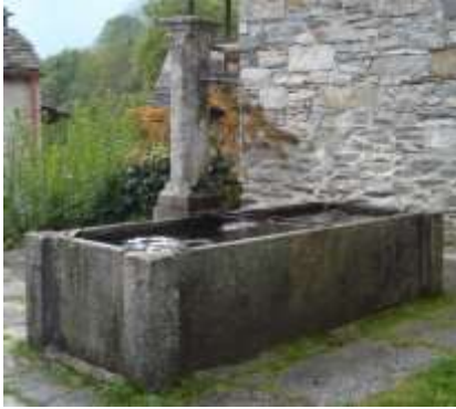
Fontana a Case Nuove

Sopra al paese in zona Case Nuove c'é una bella fontana. Da qui si vede, dall'altra parte del fiume, una bella cascata che scende dalla Val di Moett