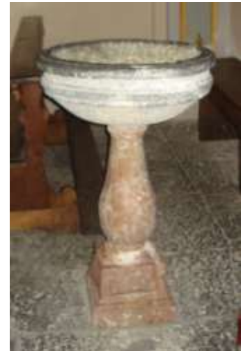
Le due acqua-santiere