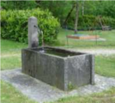
A sinistra la fontana in zona Pié della Motta