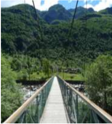
Il ponte passerella per Alnasca

Dal paese di Brione Verzasca si riprende la strada cantonale che va verso la cima della valle. Poco dopo si incontra il ponte passerella che porta ad Alnasca . Qui ci sono le diverse ronge che una volta erano un vero vivaio di pesciolini. Nel bel mezzo delle case ci sono pure due fontane.