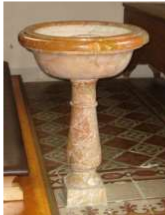
Le due acqua-santiere