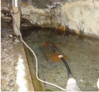
Il pescaggio automatico dell'acqua

Sota ala sc'trada che pasa da Daghei a ghé un cantinot sota tera con tanto da sorgent indoa con una pompa l'acqua la vegn portada in un deposit a circa una centena da metri püsée in sü per servii un para da cà.