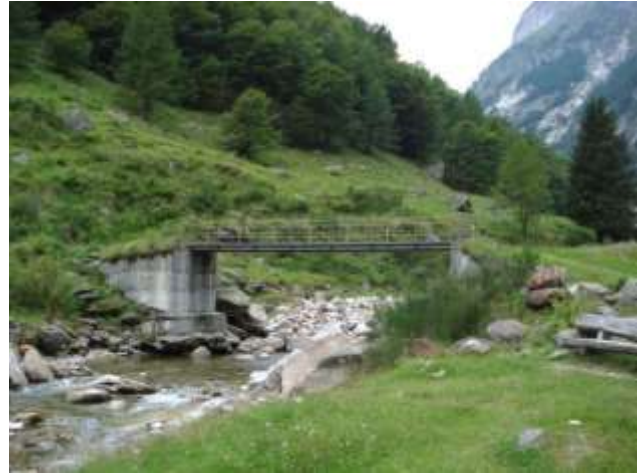
Ponte sulla Val Vogornesso nel sentiero che sale al Barone