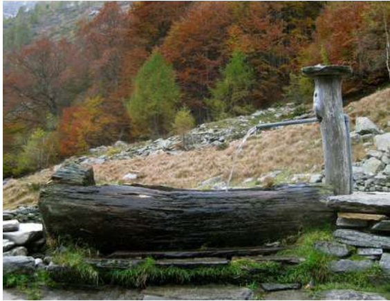
La vecchia fontana alla Capanna Osola