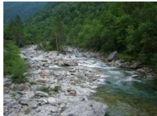
A destra il Fiume Verzasca ripreso dalla nuova passerella sul sentiero per Cordasc