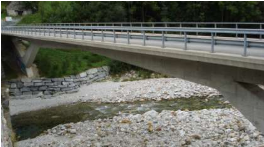
Il nuovo ponte tra Gerra e Frasco