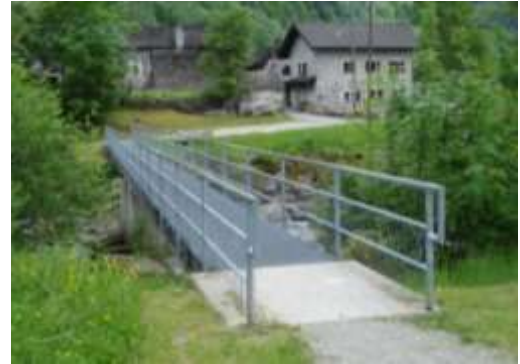
A destra la passerella sulla Val d'Efra tra Pié della Motta e Torbola