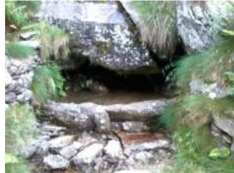
La vecchia fontana al Pianascio