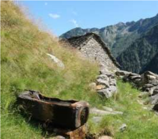
La fontana al Cortesel