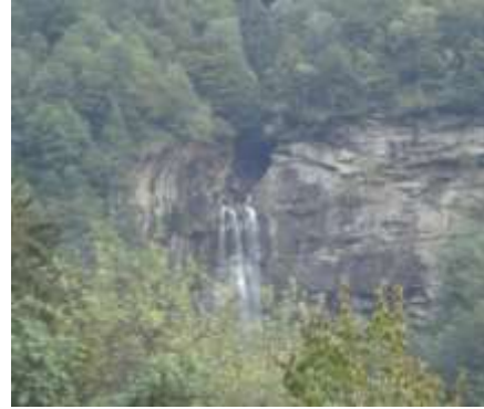
Cascata della Val di Moett

Süla sc'trada per rivàa al Cios e per nàa sü a Gesa a ghé do bei fontan