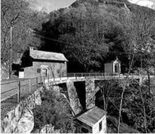
Il mulino sopra e la centralina sotto (fotografia presa da una vecchia rivista)

Poi si arriva al ponte sulla Val d'Efra dove c'è il mulino e la vecchia centralina