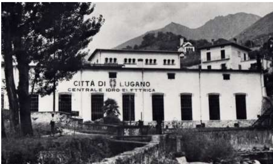
La Vecchia Centrale di Tenero