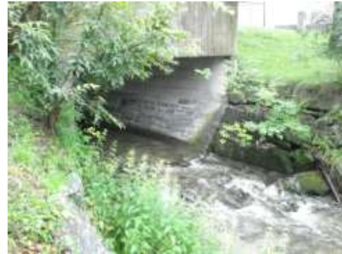
L'arrivo nel lago del riale a Mappo