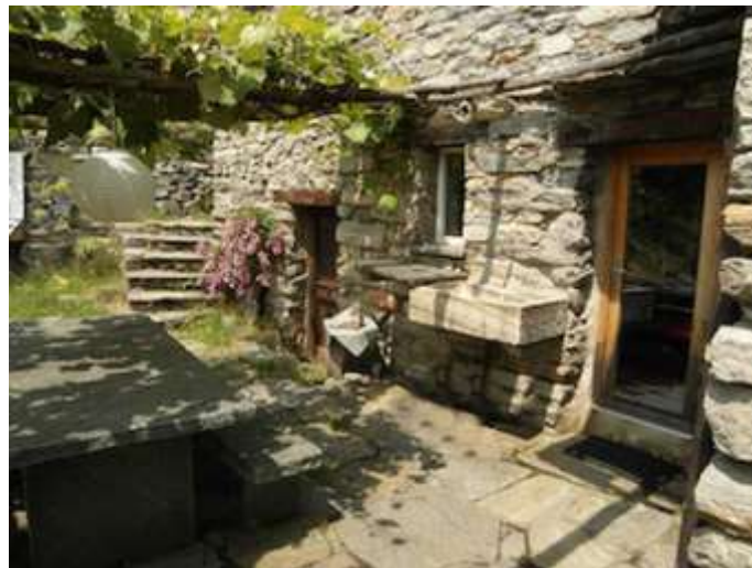
Lavandino in pietra all'esterno di un rustico a Cortoi