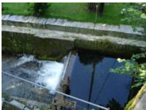
La partenza del rongione nei pressi della vecchia centrale

Fino a pochi anni fa, a lato del Fiume Verzasca , c'era il " Rongione della Cartiera " che iniziava nei pressi della vecchia centrale e che dopo essere entrato in fabbrica a servizio dei diversi macchinari andava a rovesciarsi nel lago, nella zona in cui oggi giorno c'è la piscina comunale. Ora ne esiste ancora un pezzetto, ma la chiusura totale della Cartiera e le varie trasformazioni di tutto quel territorio lo ha quasi fatto sparire totalmente. Molti anni fa vi erano pure delle rongie incanalate che partivano dal rongione e arrivavano quasi fino a Mappo . Erano regolate da delle paratie in ferro e portavano l'acqua a irrorare i campi agricoli. Quella piccola rongia passava proprio davanti al cortile di casa mia, sotto ad un pergolato di uva Clinto . Nelle serate estive la usavamo come panchina per goderci la frescura.