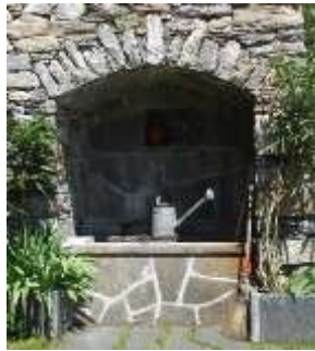
Le due fontane in zona Benit