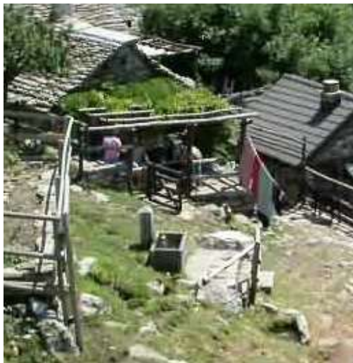
Fontana nel nucleo di Cortoi

Sopra a Mergoscia ci sono diversi bellissimi luoghi dove moltissimi rustici sono stati riattati per bene e dove la gente vi passa diversi giorni della loro vita assieme alla famiglia e agli amici. Dai sentieri che partono sopra al paese si va per esempio da una parte in direzione di Cortoi, Fosse e Porchesio che si trova a 1350 m/s/m e da quell'altra parte si va a Bresciadiga, Faedo e all'Alpe di Bietri che é a 1499 m/s/m e che sono ubicati a lato della Valle di Mergoscia .