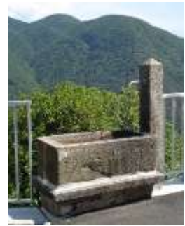
Fontana a Lissoi