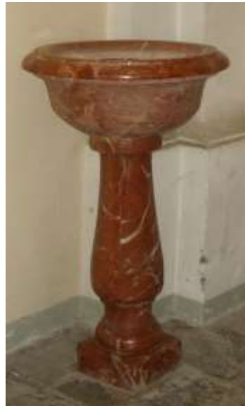
L'acqua Santiera nella Chiesa Parrocchiale di Mergoscia