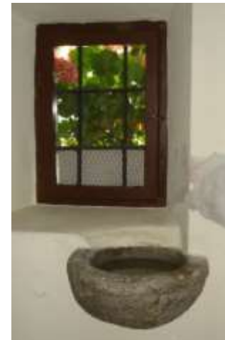
L'acqua Santiera nella Chiesetta di Lissoi a Mergoscia