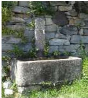
Fontana a Rivapiana

Anche nelle diverse zone che si trovano all'interno del paese di Mergoscia come Rivapiana, Bösada, Lissoi e Benit ci sono diverse fontane. Qualcuna ha la data stampata: 1913 . Quella che c'è sulla Piazza del paese invece, oltre alla croce Svizzera, ha la data del 1912