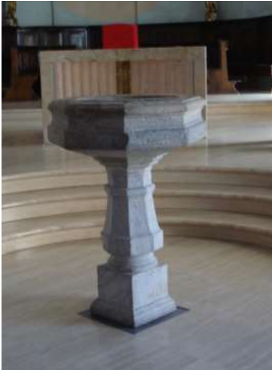
La Fonte Battesimale di Tenero