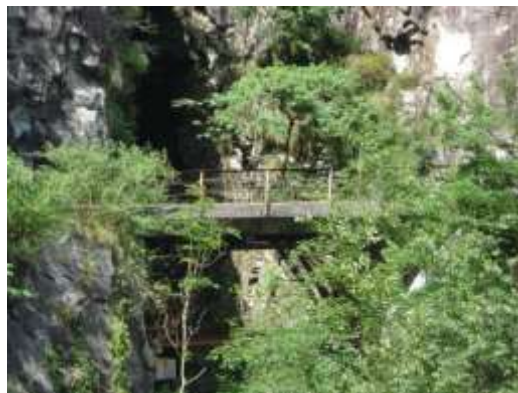
Due dei vecchi ponti sulla strada vecchia per Mergoscia