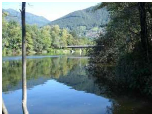
Il ponte dei pomodori e il letto del Fiume Verzasca alla foce