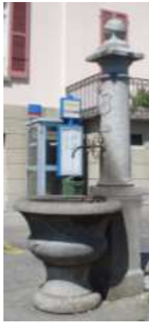
Fontana in Piazza