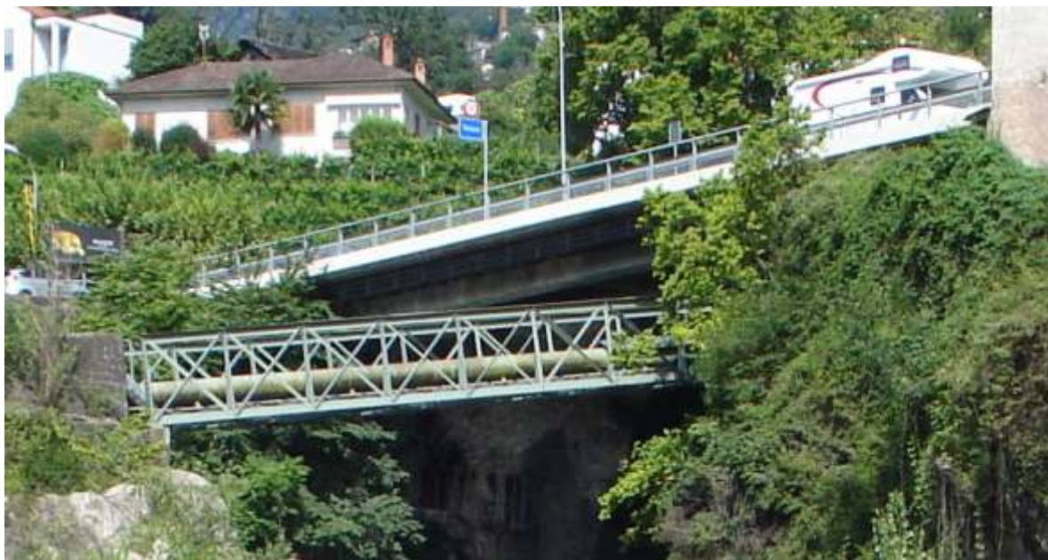
Il ponte della strada cantonale con sotto la passerella porta - tubi La fotografia é stata scattata dal sottostante "pozzone" sul versante di Tenero

Il Fiume Verzasca , dopo essere sceso tra Tenero e Gordola , va a buttarsi nel Lago Maggiore nei pressi delle Bolle . Tra la strada cantonale e il lago é attraversato da diversi ponti. Il primo é appunto quello sulla strada cantonale a nord. Li vicino c'é una specie di passerella in ferro a sostegno dei tubi che portano l'acqua dalla Chiusa di Corippo (vedi pag. 115).