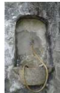
Qui a lato la piccola fontana al Cimitero →