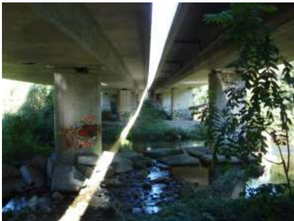
Il fiume Verzasca sotto al ponte dell'autostrada

A sud dei due paesi, prima del lago, ci sono il ponte dell'autostrada e quello dei pomodori.