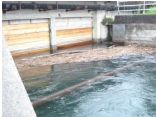
Lo scarico nel Lago Maggiore a Mappo della Diga della Verzasca