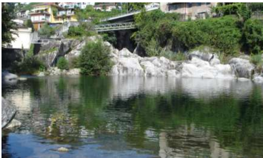
Il "pozzone" nei pressi della Vecchia Centrale