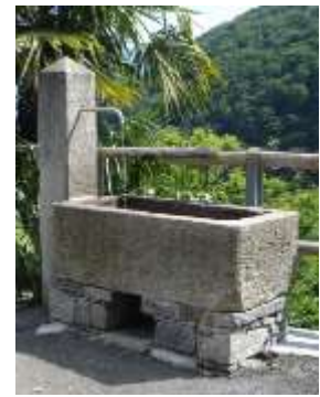
Le tre fontane a lato della strada che porta in zona Busada