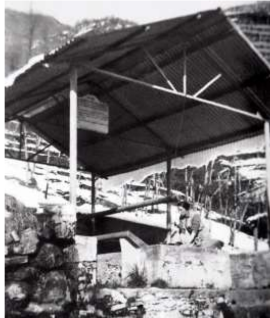
Il lavatoio di Contra in una foto presa da un vecchio libro