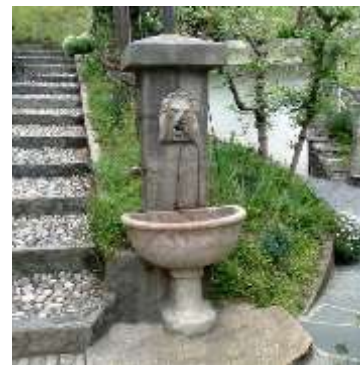
Qui a destra la piccola fontana al Grotto Scalinata →