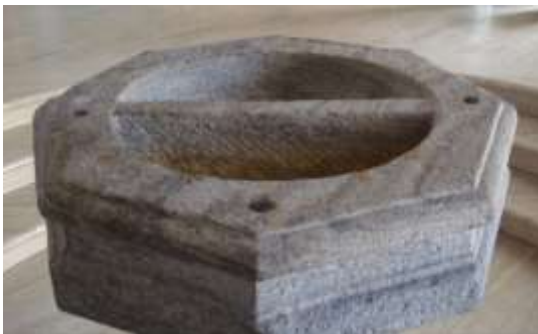
La suddivisione in granito della vasca

La Gesa da Tener l'è dedicada a S.Pietro e S.Vincenzo Martire e l'è sc'taia faia sù in gliir ala fin del 1500 .