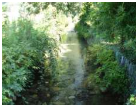
Il rongione quasi coperto dalla vegetazione nei pressi di Via Saliciolo