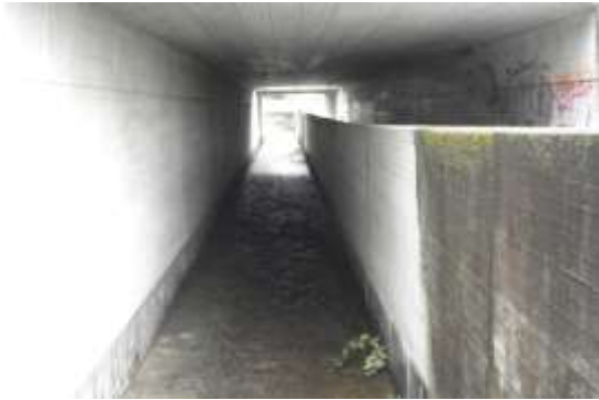
Il riale incanalato sotto all'autostrada a Mappo

Nella zona di Mappo in territorio di Minusio arrivano, da una parte il riale che parte sopra a Contra (vedi pag.38) e da un'altra parte lo scarico della Diga della Verzasca (vedi pag.92) dove esce l'acqua dopo essere passata dalle turbine.