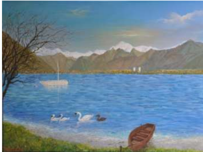
Il Lago Maggiore e il Camoghé ripresi da Rivapiana-Minusio (quadro a olio su tela dell'Artista-Pittore Fausto Corda)

Giù in fondo al paese di Tenero , dove ora sorge il Centro Sportivo Nazionale , c'era la Cura Militare con una sua azienda agricola. Nei pressi del lago c'era il " Naviglio " dove cacciatori e pescatori della zona attraccavano le loro barche. Li c'era pure una sorgente, quella che noi chiamavamo " el fontanin " che ci regalava sempre un acqua molto fredda, che poi si riversava nella vicina Bolla. Questa zona funzionava anche da porto per le barche. Ed é proprio li al "fontanin" che ci si andava a rinfrescare quando tornavamo dalle scorribande sul lago, specialmente a buzza finita, quando si raccoglieva la legna portata a valle dai fiumi ingrossati.