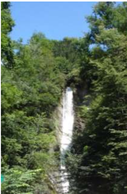
Qui a sinistra la Cascata alla ← Scalinata di Tenero

È il Pozzo della cascata alla Scalinata dove vieni investito da una bella nuvoletta di acqua fresca. Purtroppo il pozzo non ho potuto (e voluto) fotografarlo in quanto il volersi avvicinare é alquanto pericoloso ... inoltre é pieno di rifiuti ... quindi mi sono limitato a riprendere la cascata ... Nel mio viaggiare ho fatto pure volentieri una fermata al Grotto Scalinata dove vi é una piccola fontana in mezzo ai fiori.