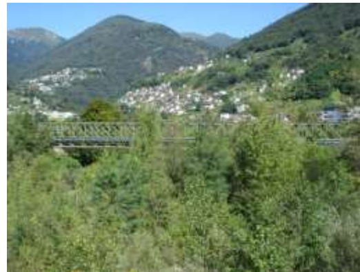
Il ponte in ferro

Giò in fond e prima del làagh a ghé el pont del'autosc'trada e chel di tomatìs.