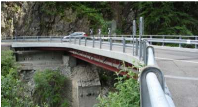
Il ponte rimesso a nuovo all'entrata della galleria sulla strada cantonale che sale a Mergoscia