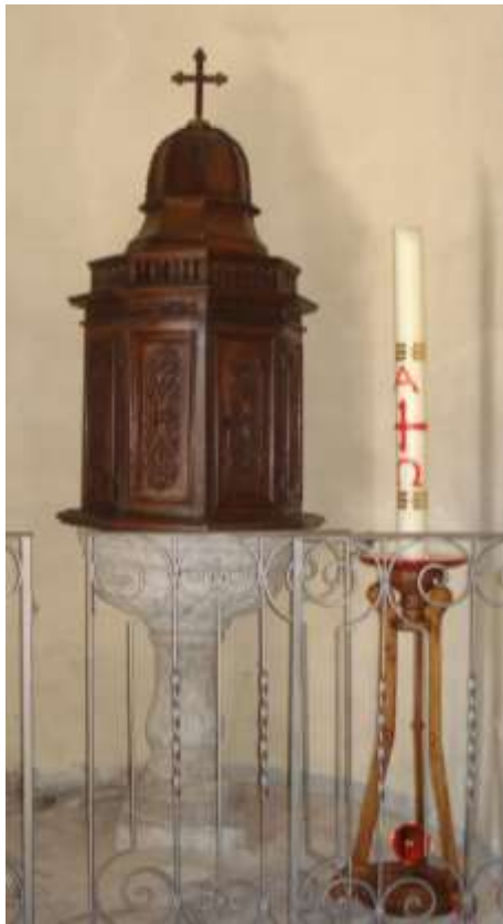
La Fonte Battesimale di Mergoscia

La Chiesa di Mergoscia é dedicada a S.Carpoforo e S.Gottardo ed é stata costruita tra il 1338 e il 1354 . Nel 1697 é stato costruito il campanile che non é attaccato alla Chiesa. Poi la Chiesa é stata ingrandita tra il 1761 e il 1765 .