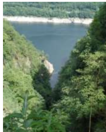
Il punto in cui la Valle di Mergoscia entra nel Lago