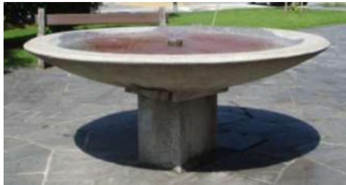
La fontana in mezzo al prato di Piazza Canevascini